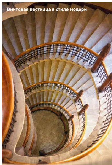
Винтовая лестница в стиле модерн