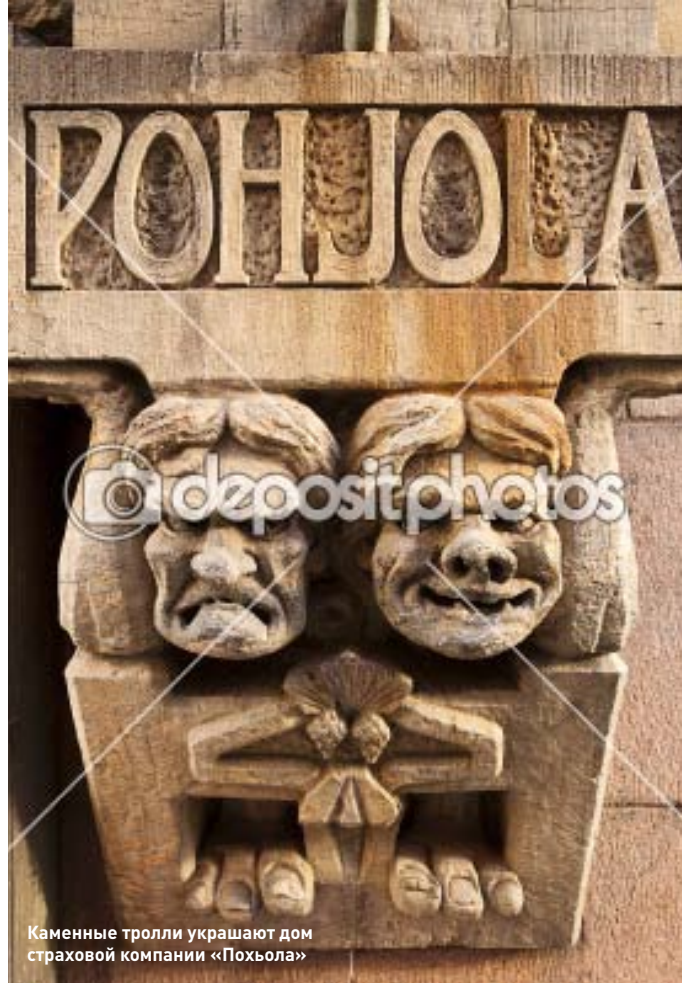
Каменные тролли украшают дом страховой компании «Похьола»

Однако не только архитекторы хотели объединяться. Художники также приняли активное участие в формировании облика столицы. Один из самых известных финских художников — Аксели Галлен-Каллела — работал над проектом Дома врачей (Фабриканкату, 17) и создал фрески для вестибюля Национального музея, придав особое,