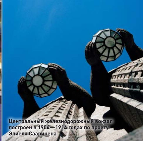
Центральный железнодорожный вокзал построен в 1904—1914 годах по проекту Элиэля Сааринена