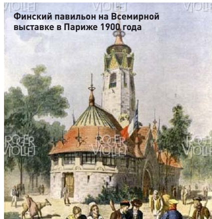
Финский павильон на Всемирной выставке в Париже 1900 года

эпическое звучание финскому романтизму. Построенный по индивидуальному проекту дом Галлен-Каллела, который находится недалеко от Хельсинки, теперь превращен в музей.