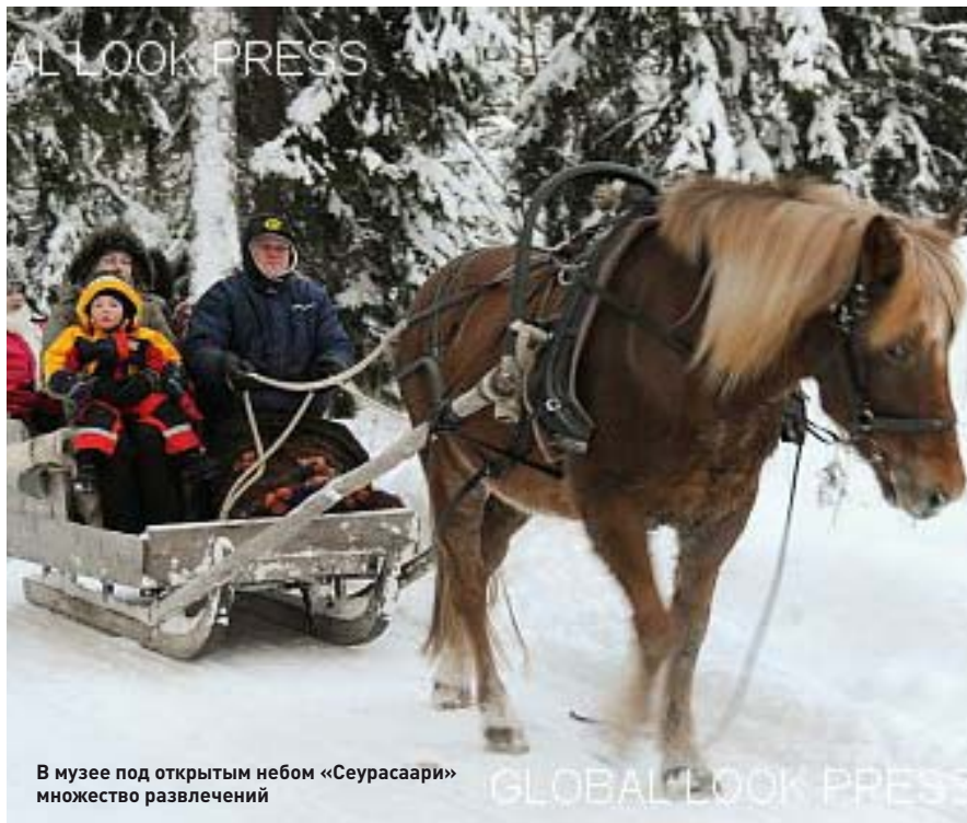
В музее под открытым небом «Сеурасаари» множество развлечений

” В последней четверти XIX века в архитектуре Финляндии формируется национальный вариант модерна — ведущего стиля эпохи, определившего облик и атмосферу финской столицы.