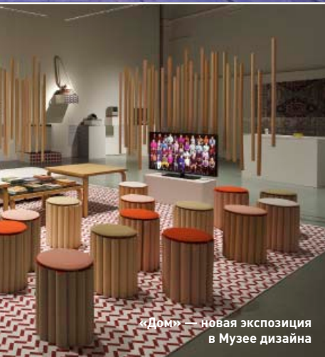
«Дом» — новая экспозиция в Музее дизайна